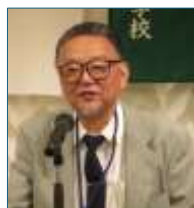
在京佐高会副会長