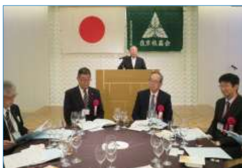
令和6年10月6日(日)在京佐高会総会・懇親会 ではご挨拶を賜わり、ありがとうございました。 お二方様には、今年も宜しく願いいたします。

さて、「新校舎」は、外見ではほぼ出来上がったように見受けられ、これから内装工事が始まるのかと思っております。「新校舎」の工事が進むに伴って、5月21日には「新校舎落成記念事業実行委員会」を設立開催いたしました。委員会の主な事業は、来秋11月に予定している①記念式典の開催、②記念モノメントの作成、設置、③その他となっております。本校同窓会、