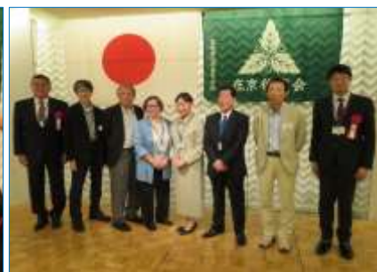
高28～33回生グループと先生方