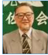
副会長兼会計担当