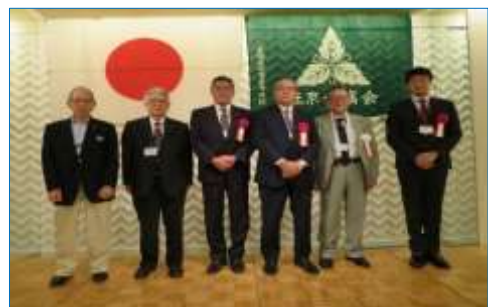
ご来賓と顧問の皆様