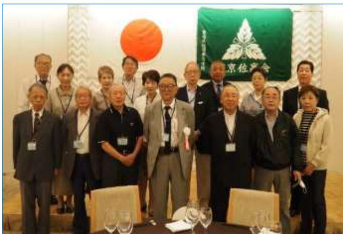
令和6年10月6日(日)、在京佐高会総会懇親会 記念写真⑤役員一同、⑥ご来賓・顧問の皆様

親を深めていただきたいと思います。 在京佐高会の役員一同、心よりお待ちしております。