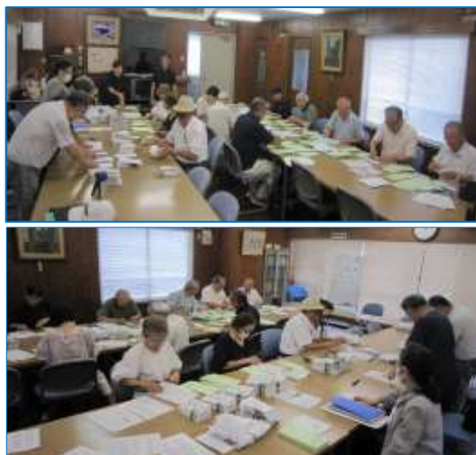
※写真は全員で役割毎に封入作業の様子です。

このような役員の一生涯懸命な姿を思い浮かべて、私どもの心意気を感じ取っていただければと願っています