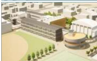
完成図①正門側から俯瞰②全景とグラウンド